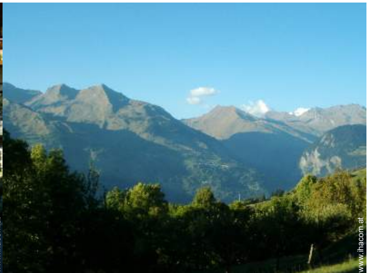
Blick auf Gebirge