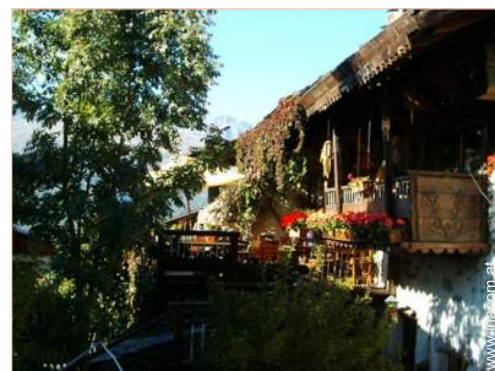
Holzchalet mit Charme