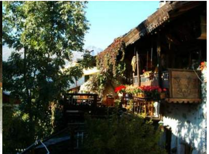
Holzchalet mit Charme