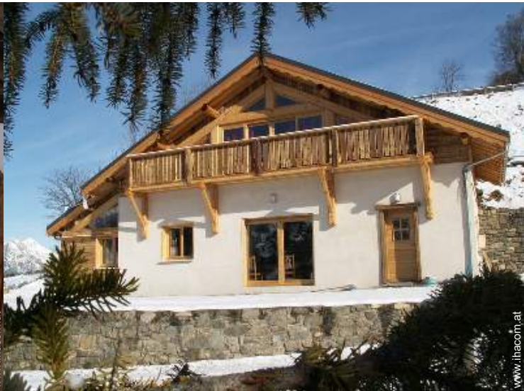
Bergchalet mit Charme