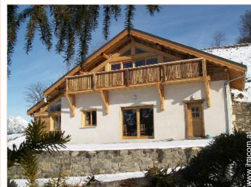
Bergchalet mit Charme