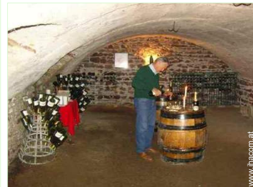
Weinkeller und Weindegustation