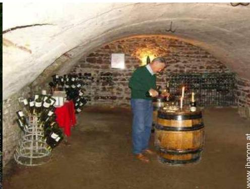
Weinkeller und Weindegustation