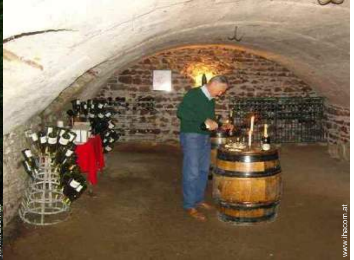
Weinkeller und Weindegustation