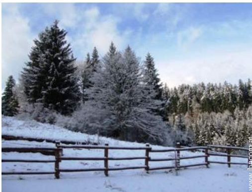
Blick auf Wald