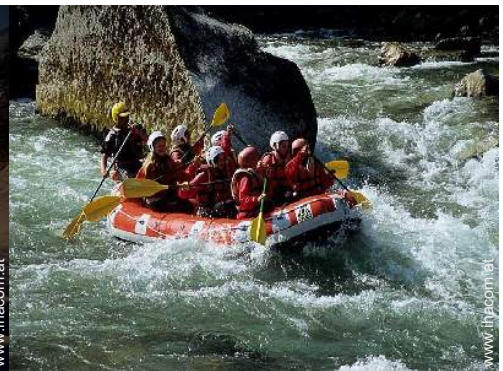
Sommeraktivitäten in der Nähe