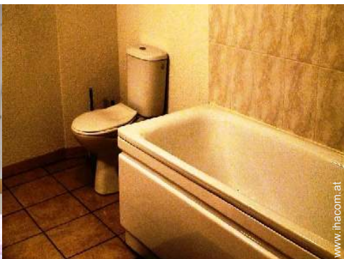
Raumaufteilung und Annehmlichkeiten