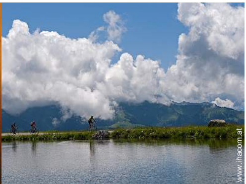
Freizeitaktivitäten in der Nähe