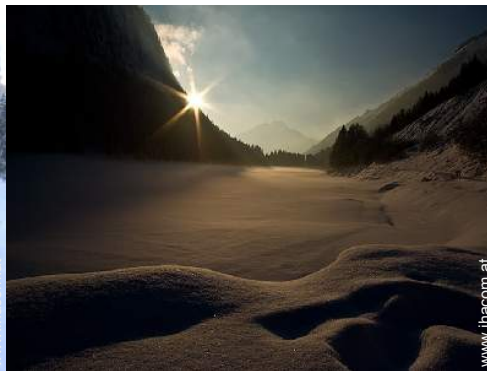
Winteraktivitäten in der Nähe