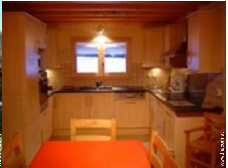
große amerikanische Küche