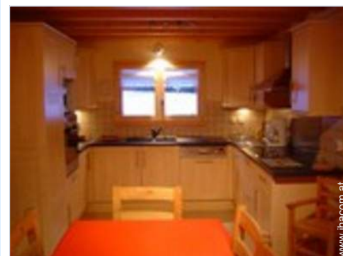
große amerikanische Küche