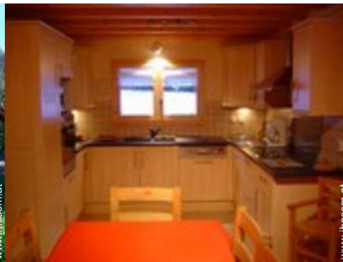
große amerikanische Küche