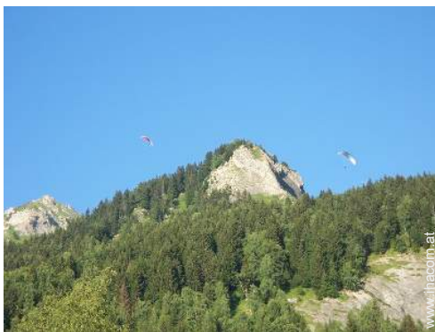
Flugsport in der Nähe