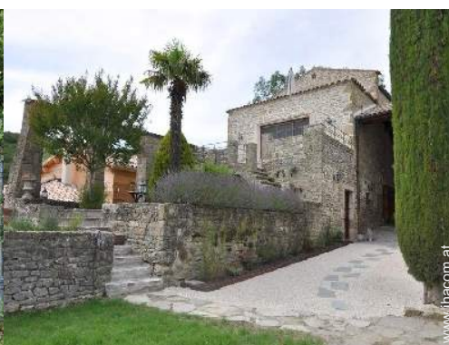
exklusives provenzalisches Haus