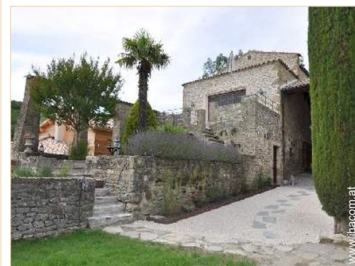
exklusives provenzalisches Haus