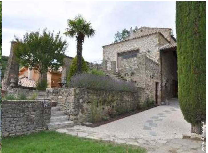
exklusives provenzalisches Haus