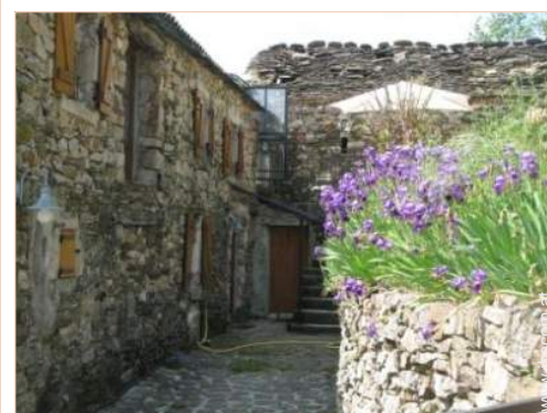
Steingebäude mit Charme