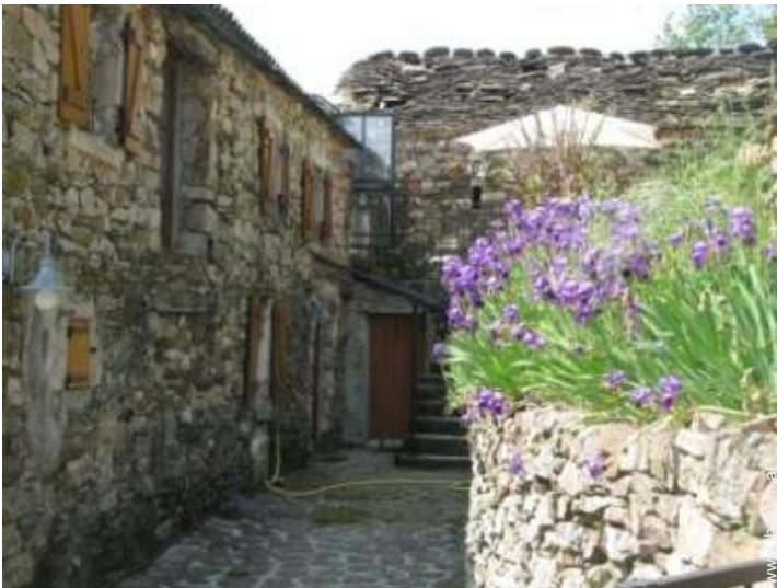
Steingebäude mit Charme