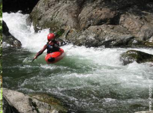
Blick auf Fluss