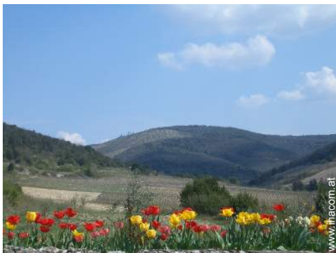
Blick auf Weinberge