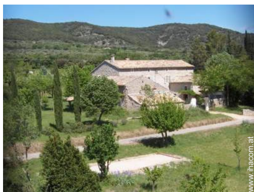
Bauernhaus mit Charme (Mas)