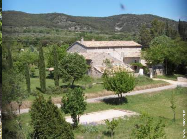
Bauernhaus mit Charme (Mas)