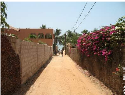
Attraktionen und Entspannung