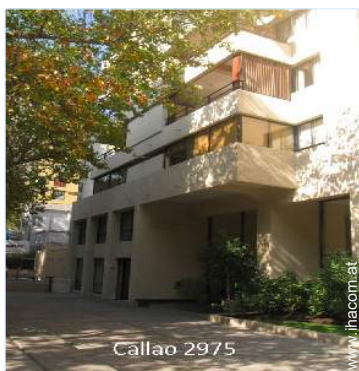
Callao 2975 Wohngebäude