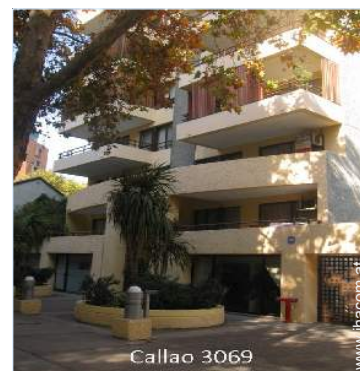
Callao 3069 Wohngebäude