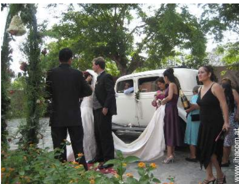
Attraktionen und Entspannung