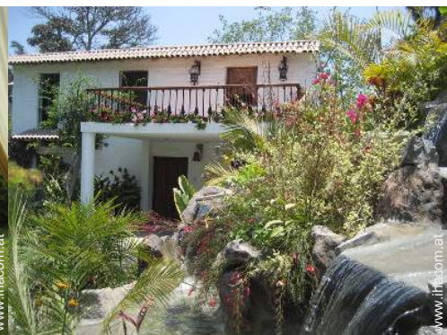
Anwesen mit Charme