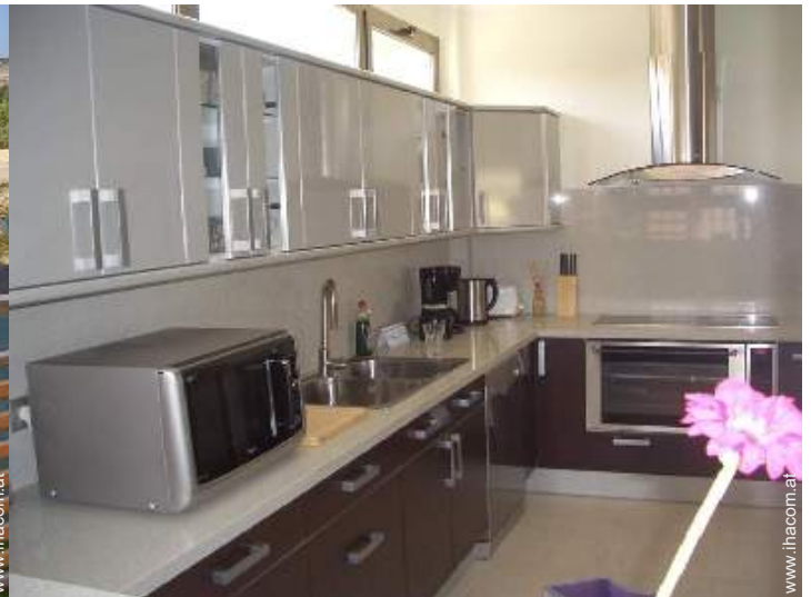
große separate Küche