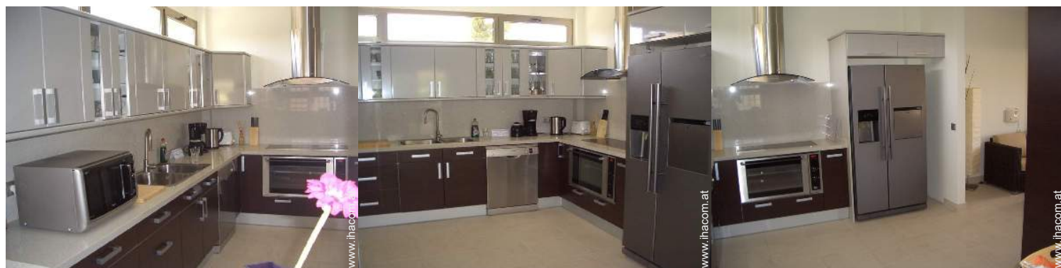
große separate Küche