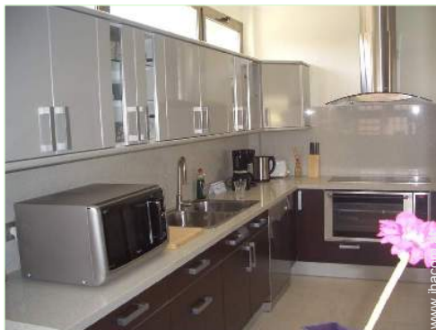
große separate Küche