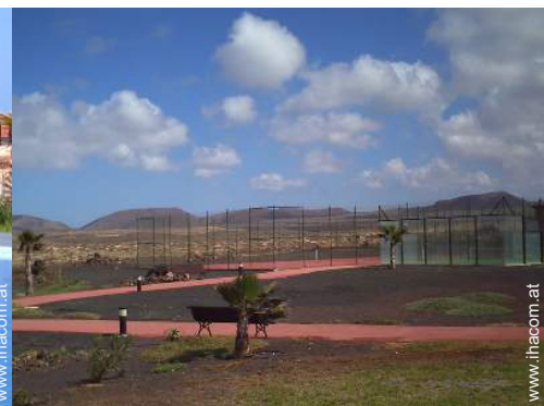
Tennisplatz - synthetischer Belag