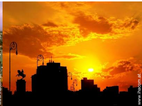
Blick auf Denkmal