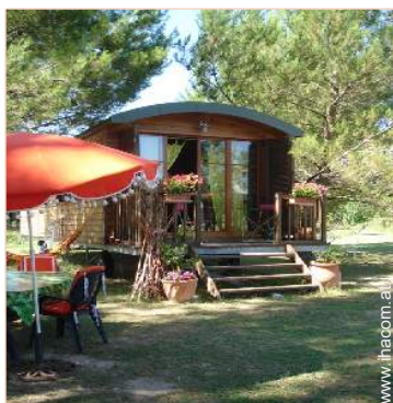
Wohnwagen mit Charme