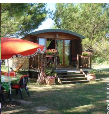
Wohnwagen mit Charme