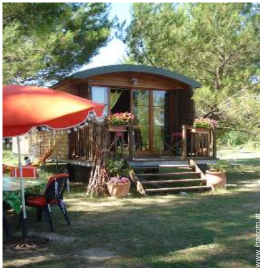
Wohnwagen mit Charme