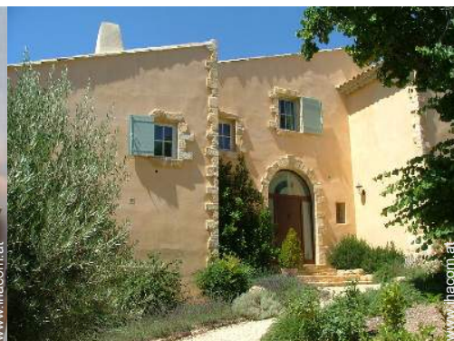
exklusives provenzalisches Haus