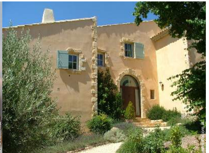
exklusives provenzalisches Haus