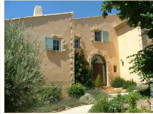
exklusives provenzalisches Haus