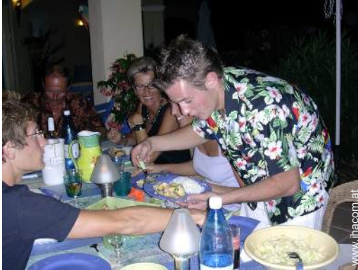
Table d'Hôte (Gemeinschaftstafel)