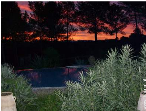
Blick auf Sonnenuntergang