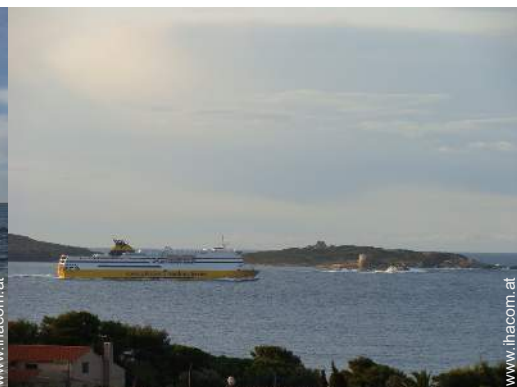
Wassersport in der Nähe