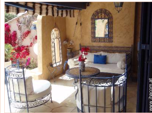
Haus mit Charme