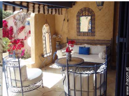
Haus mit Charme