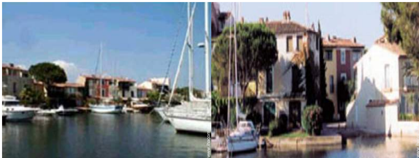
Blick auf Platz