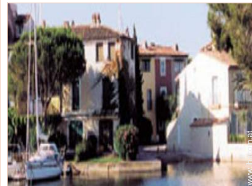
Blick auf Platz