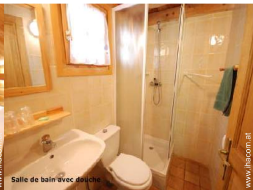
Salle de bain avec douche