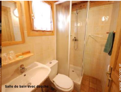
Salle de bain avec douche