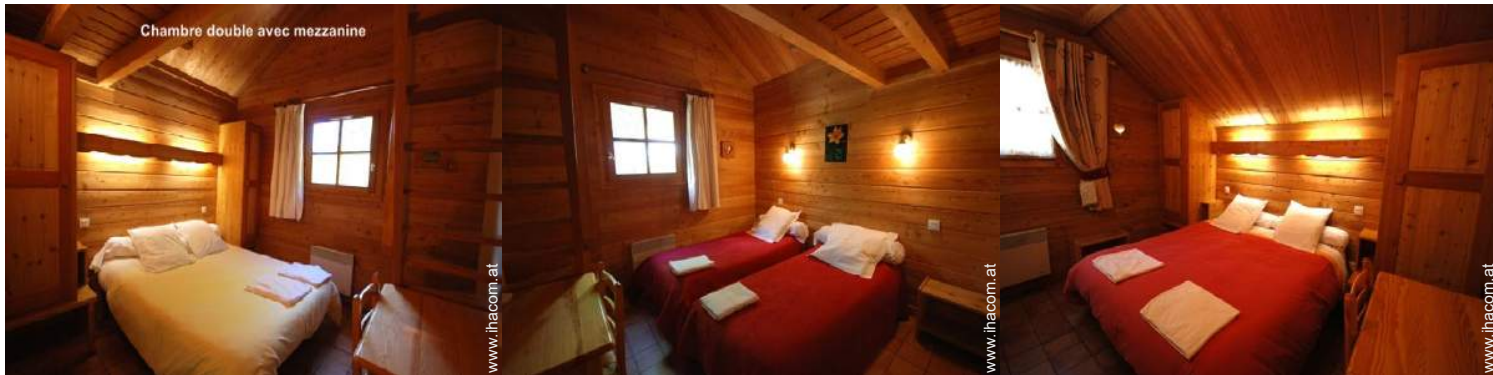
Chambre double avec mezzanine