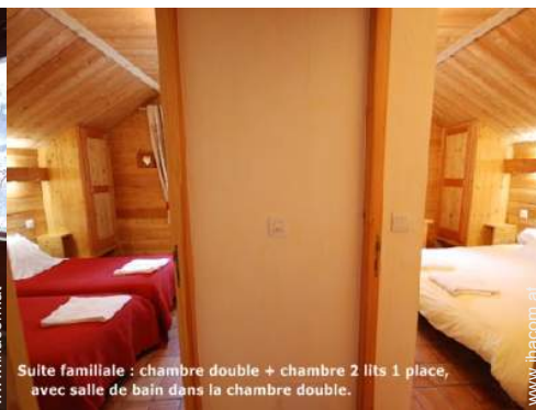
Suite familiale : chambre double + chambre 2 lits 1 place, avec salle de bain dans la chambre double.