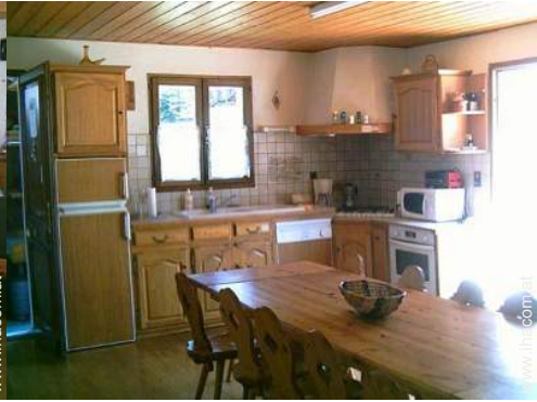
große amerikanische Küche