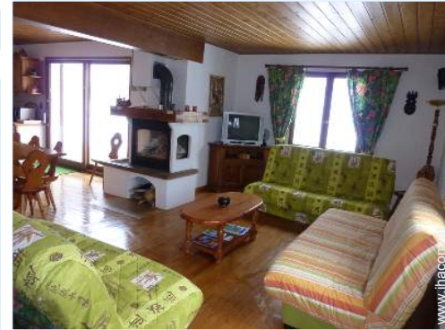
Innenkomfort und Ausstattung