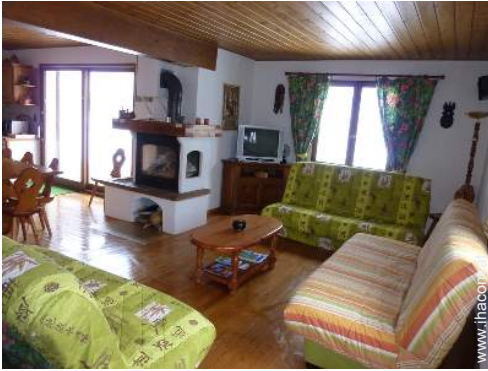
Innenkomfort und Ausstattung