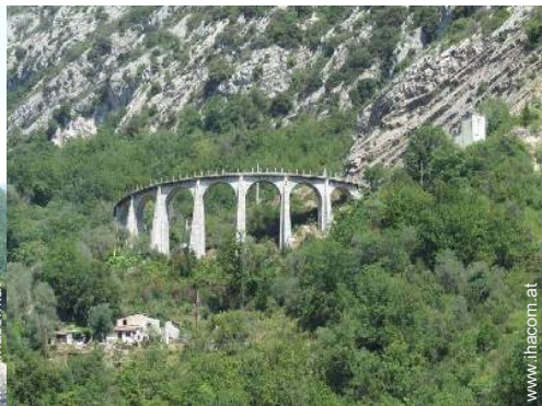
Via ferrata (Klettersteig)