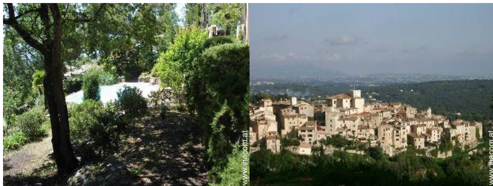
Blick aufs Land