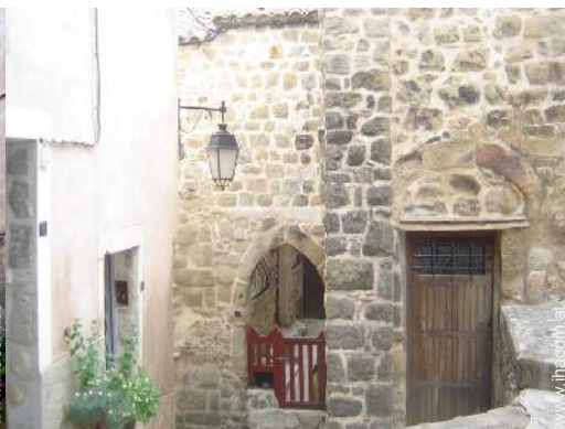
Blick auf Dorfzentrum