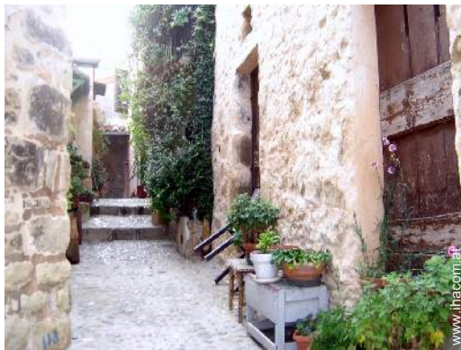
Blick auf Dorfzentrum