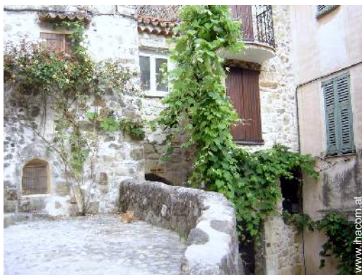
Blick auf Dorfzentrum