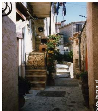
Blick auf Dorfzentrum