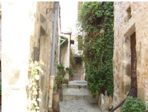
Blick auf Dorfzentrum