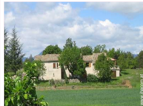
provenzalisches Haus mit Charme