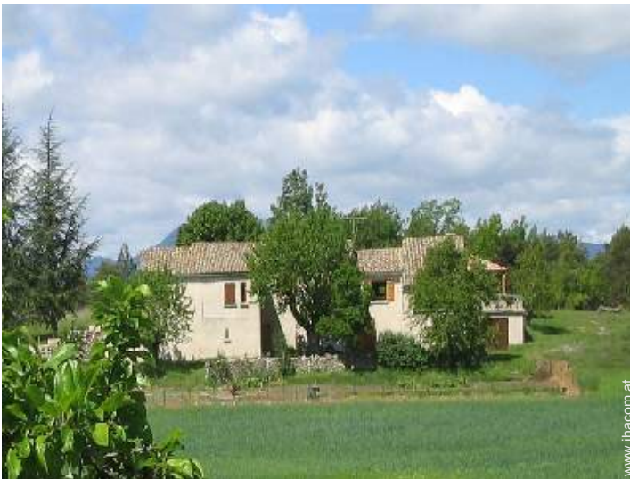
provenzalisches Haus mit Charme