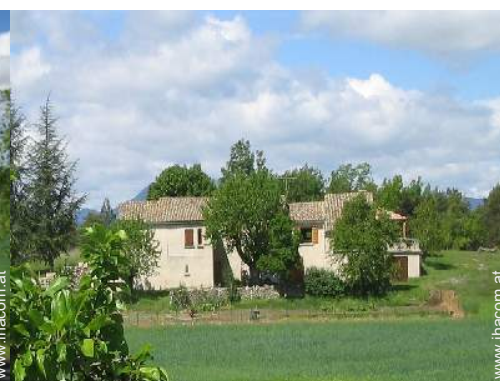
provenzalisches Haus mit Charme