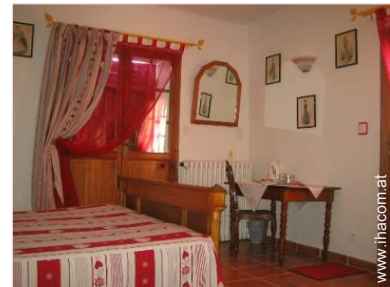
Raumaufteilung zur Verfügung der Gäste

Terrasse 20m 2 , überdachte Terrasse 30m 2 , Gartentisch(e), 6 Gartenstuhl/-stühle, Laube, Sonnenschirm, 4 Liegestuhl/-stühle, Hollywoodschaukel