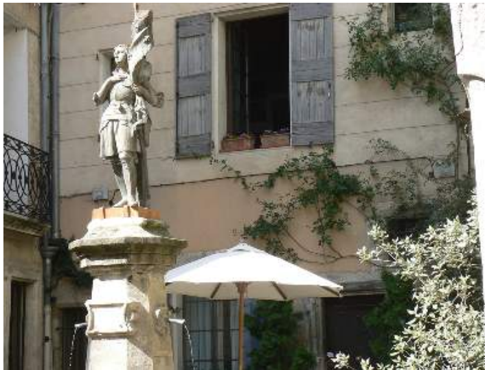
Steinhaus mit Charme