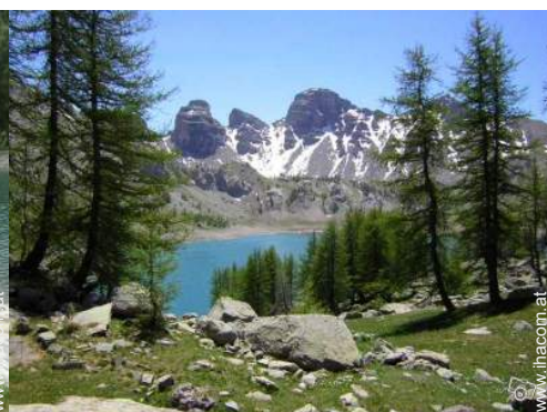
Sommeraktivitäten in der Nähe