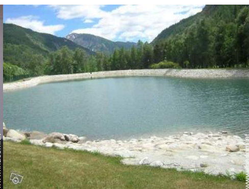
Sommeraktivitäten in der Nähe