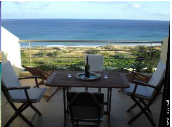
Blick auf Ozean