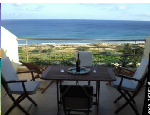
Blick auf Ozean