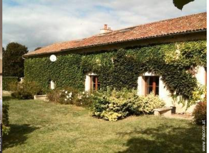
Charakterhaus mit Charme