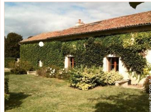
Charakterhaus mit Charme