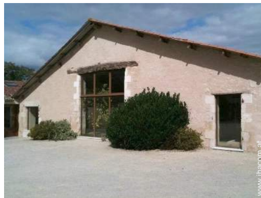
Charakterhaus mit Charme