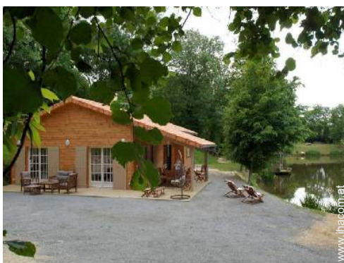
Holzhaus mit Charme