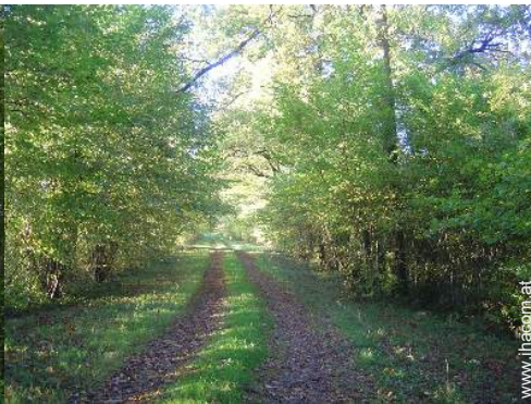
Äußerer Rahmen zur Verfügung der Gäste