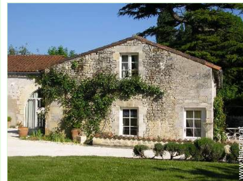
Haus mit Charme