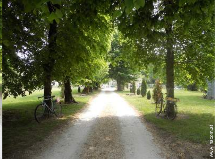
Anwesen mit Charme