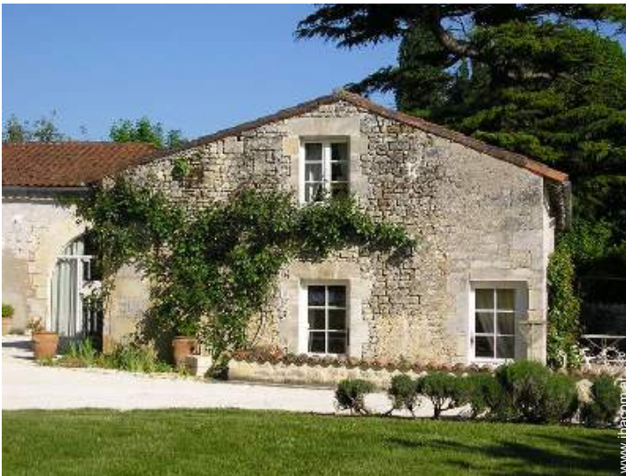
Haus mit Charme