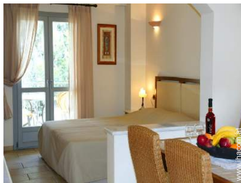
Maisonette mit Charme