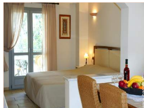
Maisonnette mit Charme