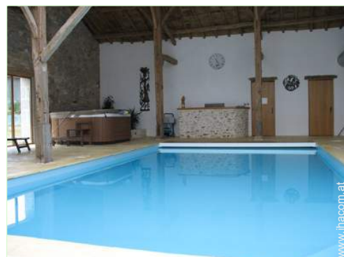
Swimmingpool im Haus