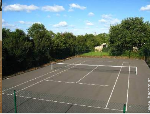
Tennisplatz - harter Belag