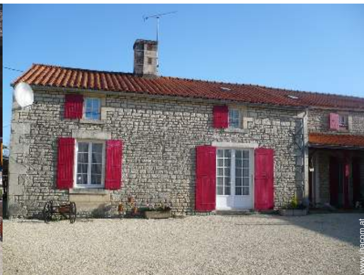
ehem. Bauernhaus mit Charme