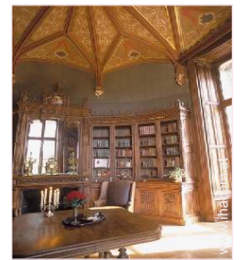
Raumaufteilung zur Verfügung der Gäste