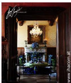
Raumaufteilung zur Verfügung der Gäste