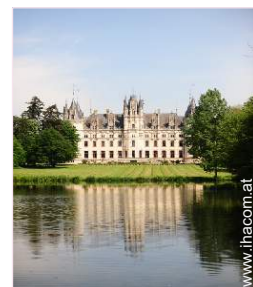
Äußerer Rahmen zur Verfügung der Gäste