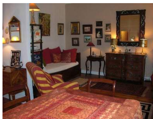
Schrankbett(en) 2 Personen