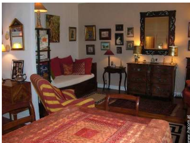
Schrankbett(en) 2 Personen