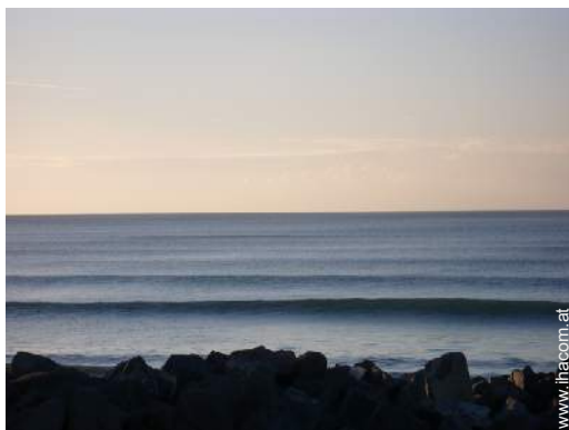
Badevergnügen in der Nähe