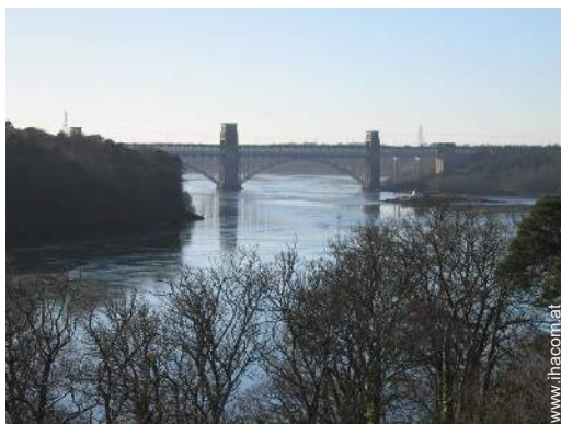
Wassersport in der Nähe