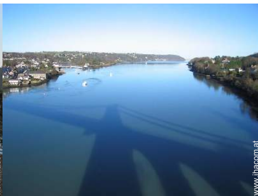
Badevergnügen in der Nähe