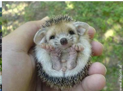
Park und Garten