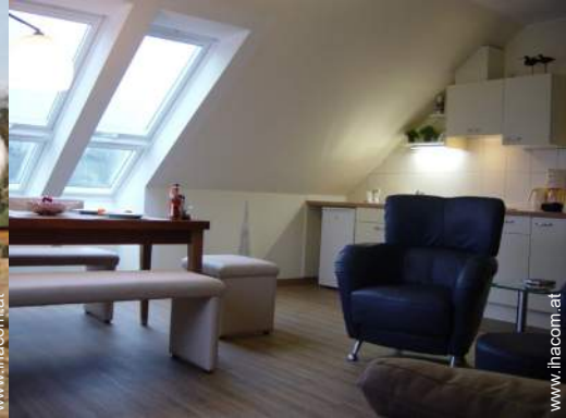
Raumaufteilung und Annehmlichkeiten