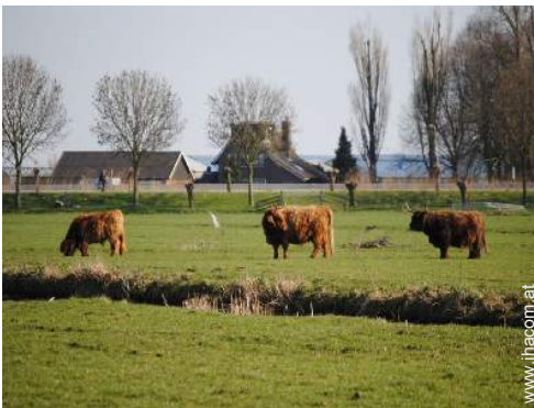
Blick auf Wiese