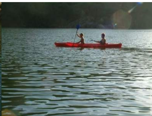
Wassersport in der Nähe