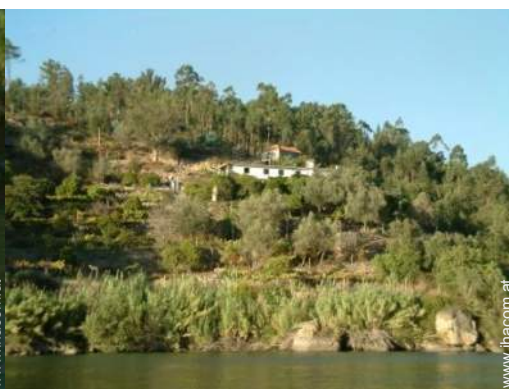
Anwesen mit Charme