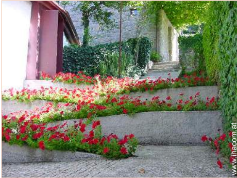
Anwesen mit Charme