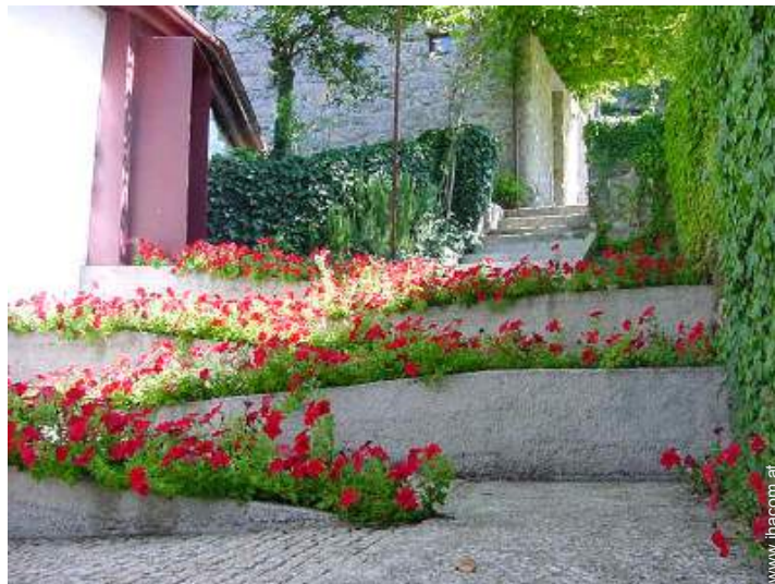
Anwesen mit Charme