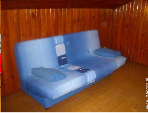
Schrankbett(en) 2 Personen