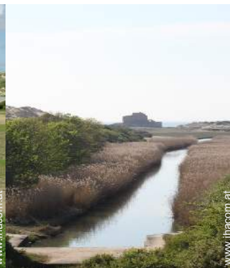
Blick auf Fluss