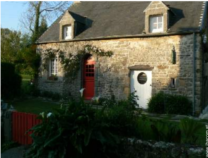
Charakterhaus mit Charme