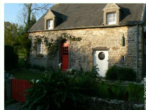
Charakterhaus mit Charme